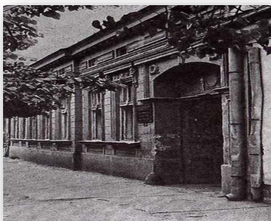
Школа 1946. године

У току рада школе у њој су се образовали различити профили: медицинске сестре, лабораторијски и фармацеутски техничари од 1960. године, зубни техничари од 1966. године, санитарни техничари од 1978. године, радиолошки техничари од 1979. године, физиотерапеутски техничари од 1984. године, стоматолошке сестре техничари од 1991. године, фризери од 1987. године, од 1999. године педијатријске сестре, од 1980. године и 2002. године гинеколошко-акушерске сестре, а од 2003. године и козметички техничари. Од 2016. године, школа је верификована и за образовне профиле медицинска сестра-васпитач и здравствени неговатељ. Тренутно имамо 803 ученика, с обзиром да је од шк. 2024/2025. год. ступила на снагу измена Закона о средњем образовању и васпитању (Сл. гласник 92/2023) па одељења првог разреда имају по 28 ученика. Настава се одвија у осам образовних профила и 28 одељења, број запослених је 102, настава се реализује на српском језику. Школа се у свом раду ослања на сарадњу са великим бројем социјалних партнера. Од самог почетка рада школе постоји велико интересовање ученика за упис у школу.