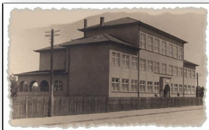
Задужбина др Андра Јовановића 1946. године