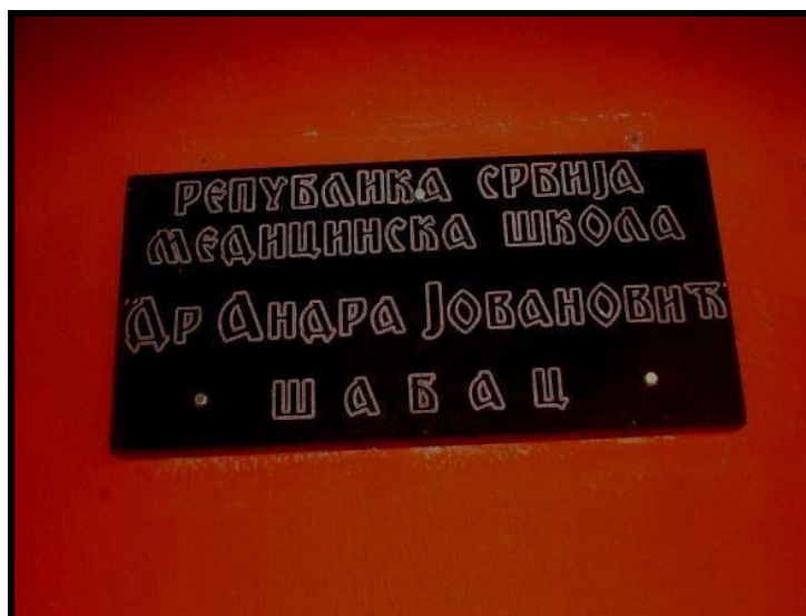
Табла са називом Школе