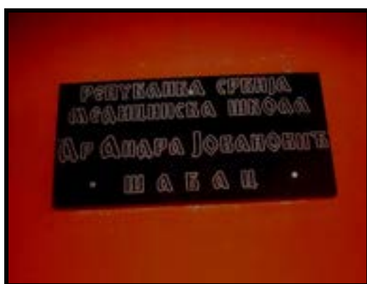
Табла са називом Школе, 2003.