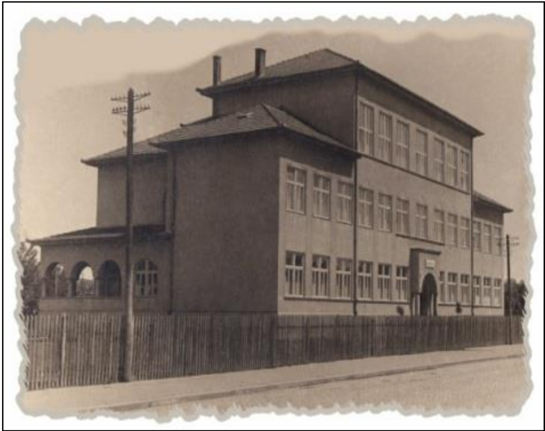
Задужбина др Андре Јовановића