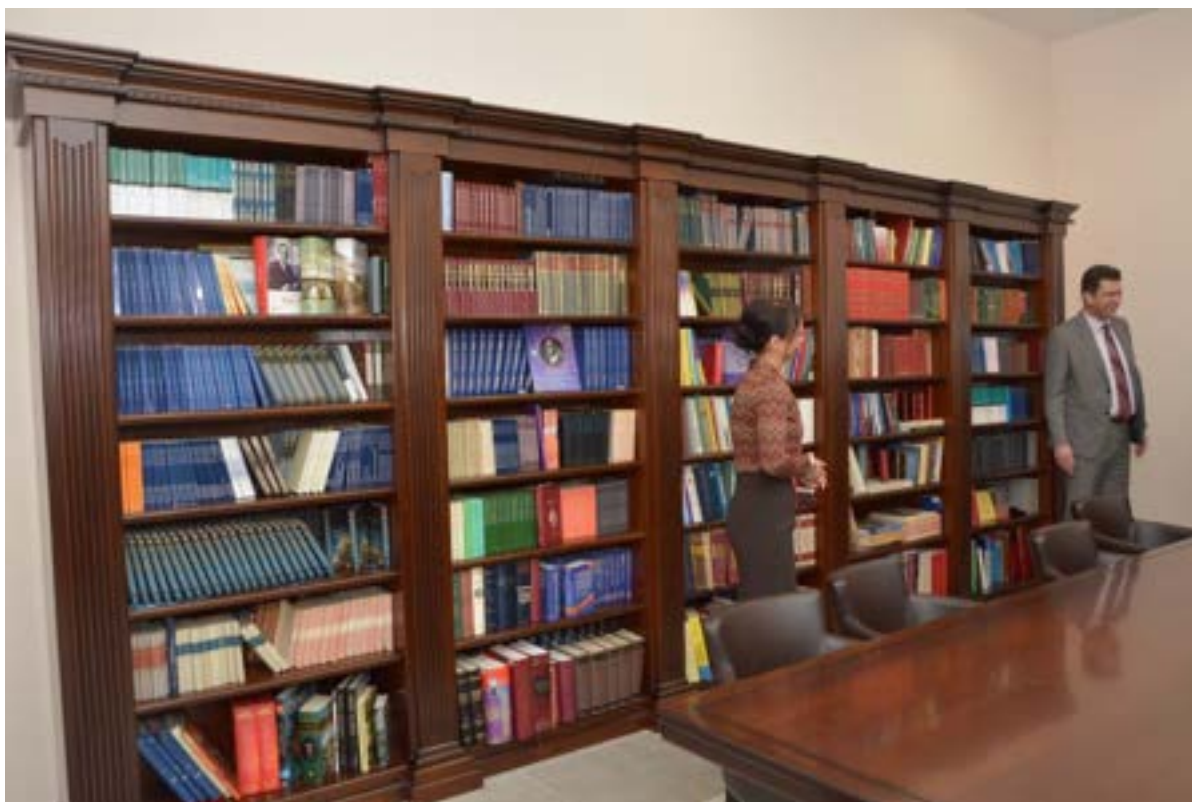
У присуству министра просвете господина Младена Шарчевића свечано отварање реновинаране школске библиотеке