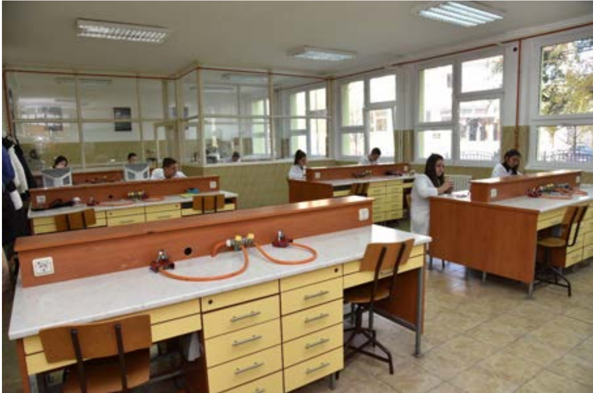
Кабинет зубних техничара