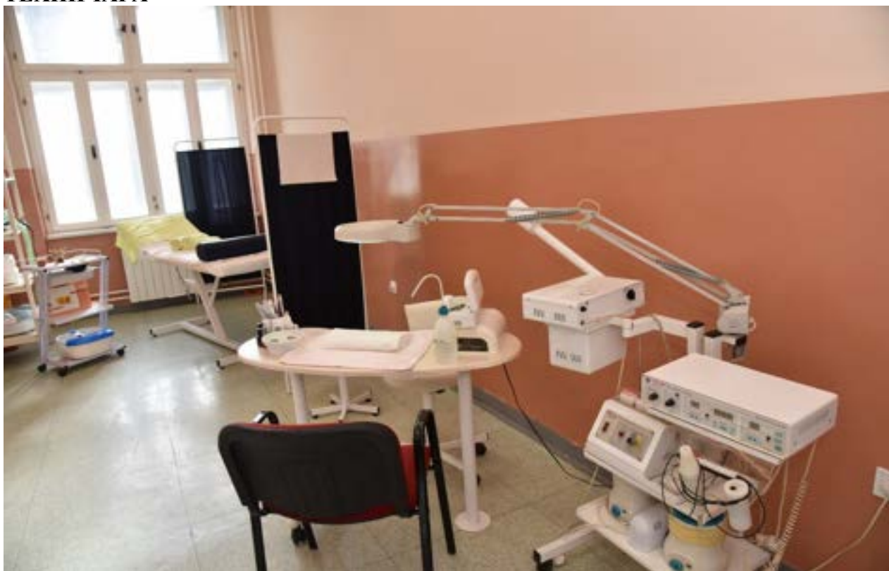
Кабинет козметичких техничара