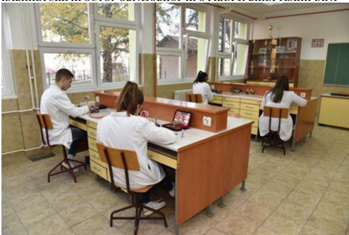
Кабинет зубних техничара