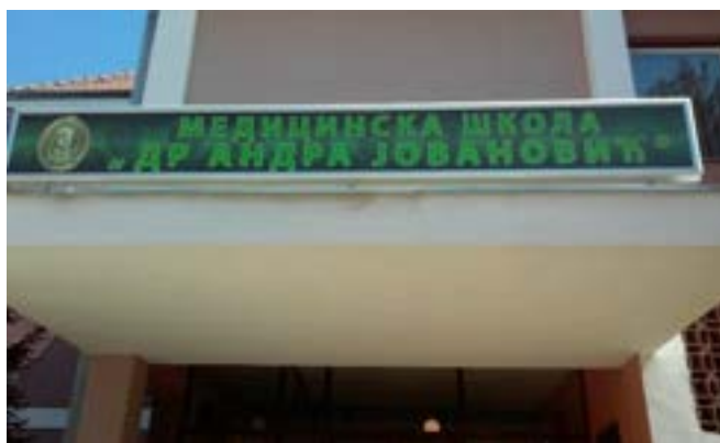
Табла са називом Школе, 2013.