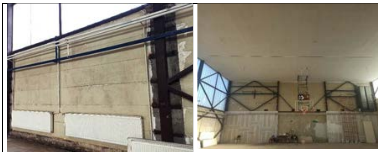
Изглед фискултурне сале пре реконструкциј