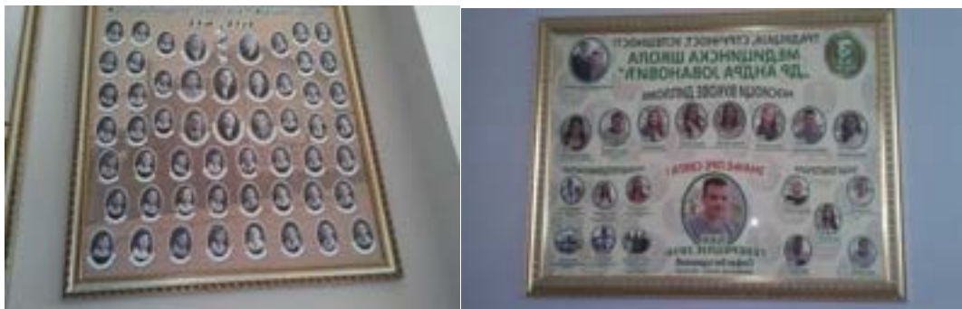
Матуранти наше Школе, некад и сад

Ходнике Медицинске школе „Др Андра Јовановић” оплемењују слике које величају праве вредности.