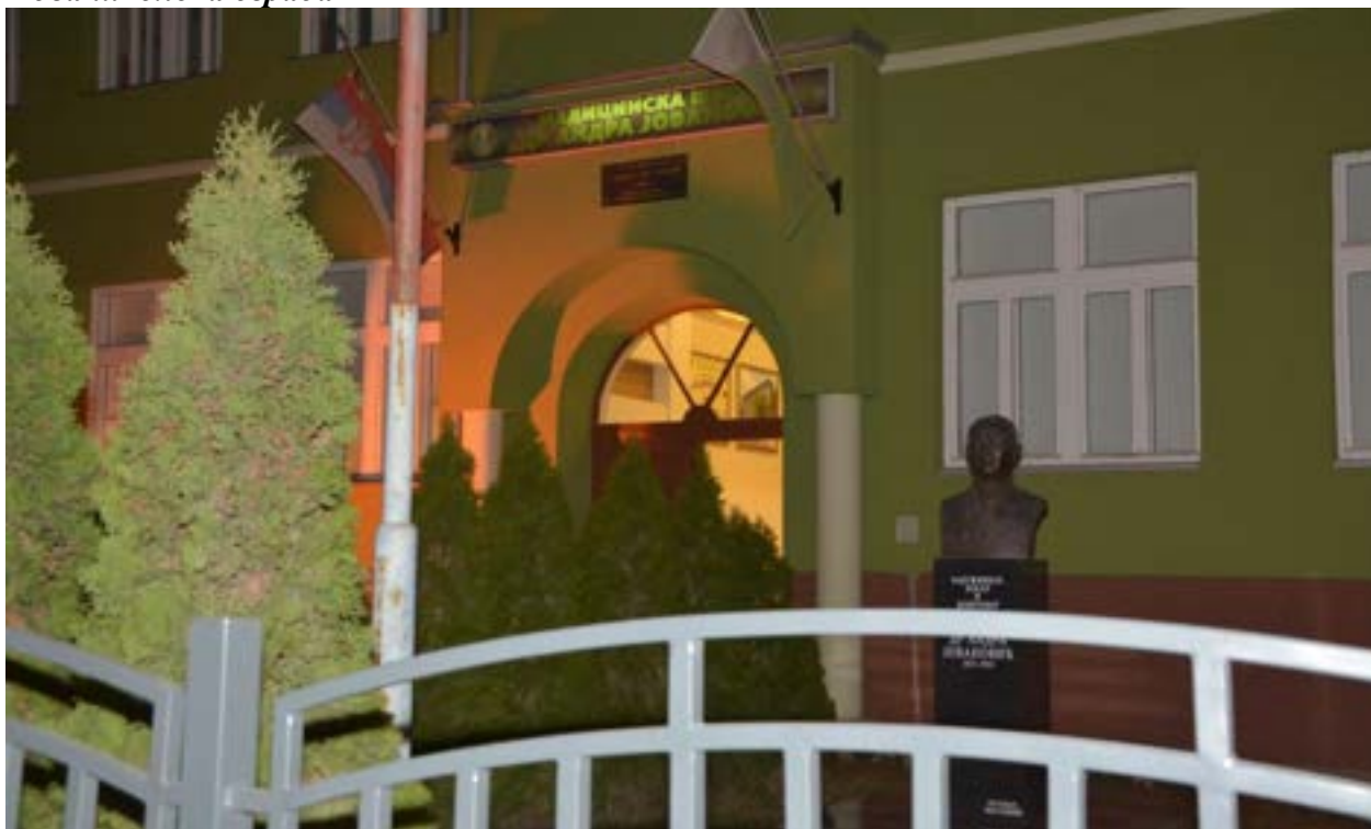
Нова школска ограда