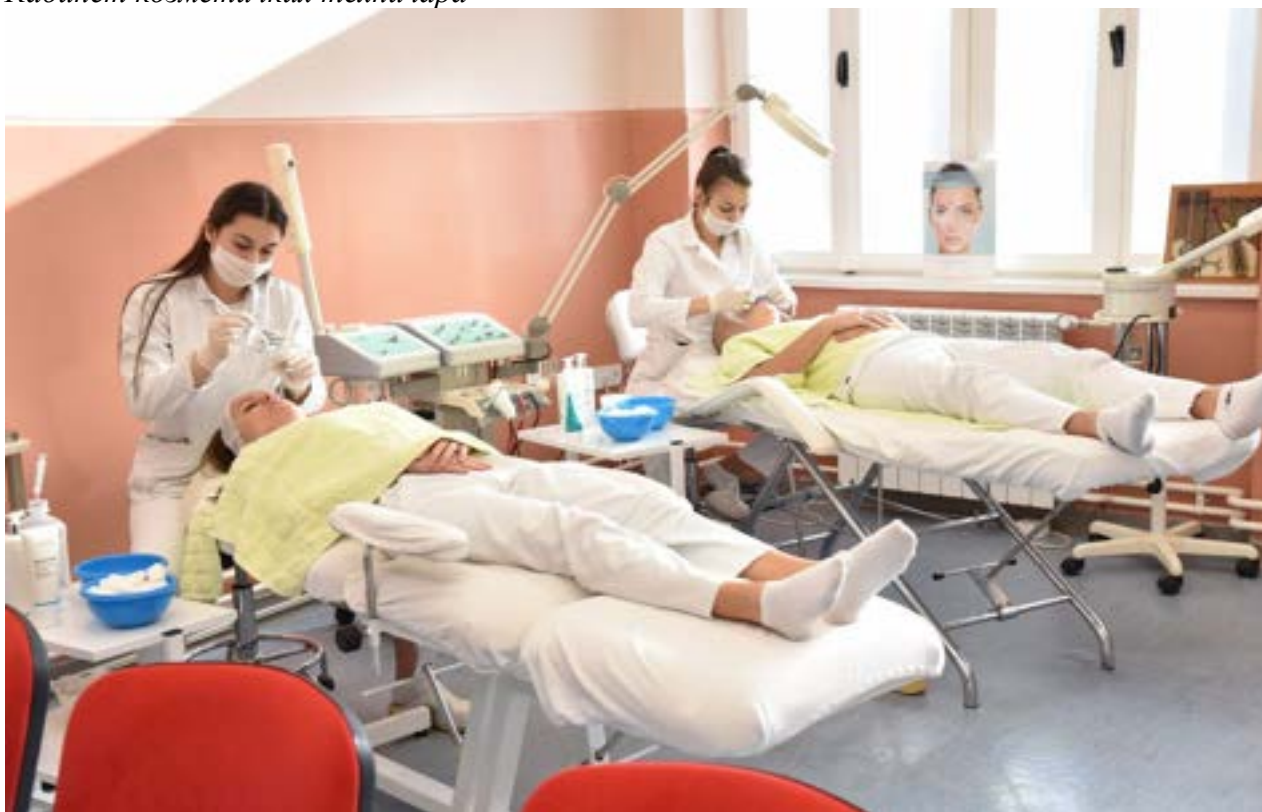
Кабинет козметичких техничара