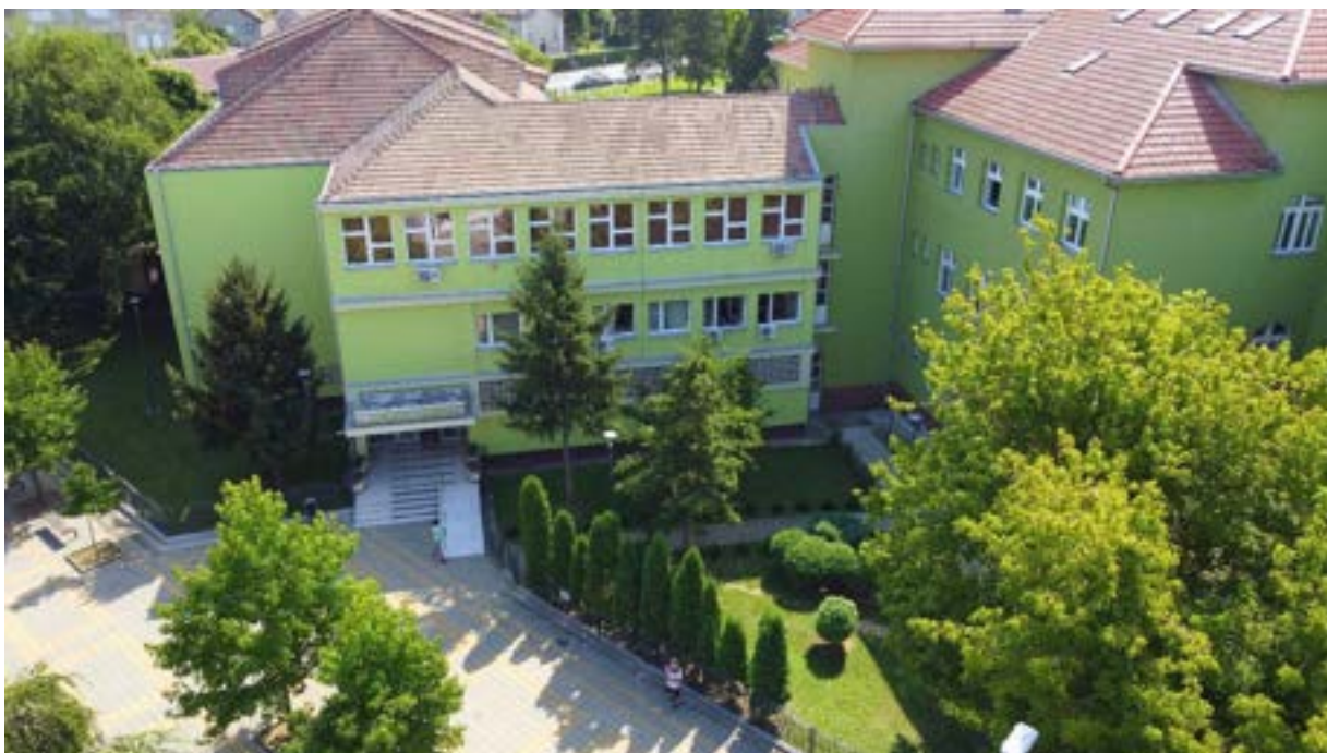
Додатно озелењавање дворишних површина допринело је пријатнијем амбијенту