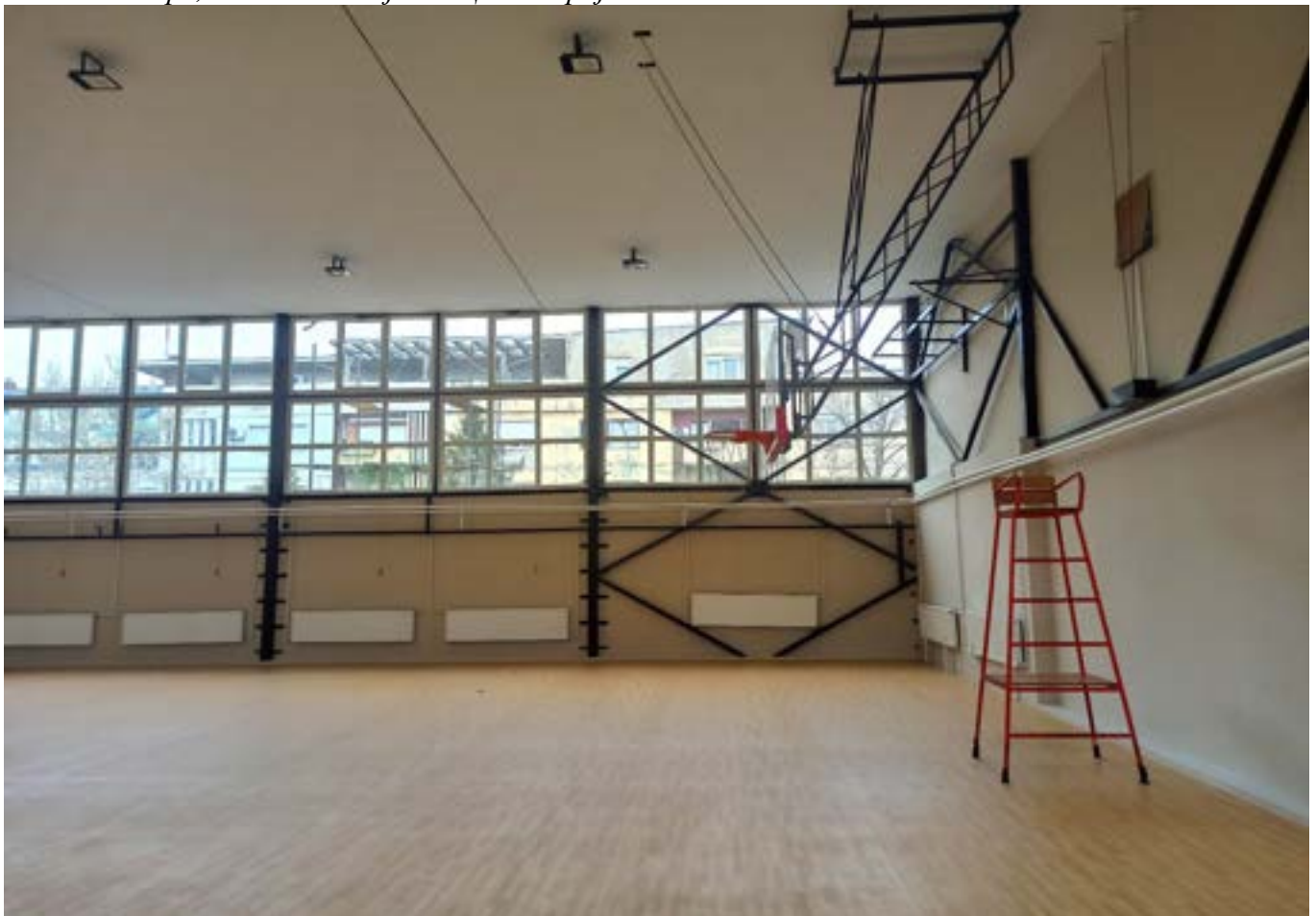
Замењен је под, адаптирани зидови, пренаштелован систем за грејање и вентилацију, а физкултурне справе и елементи освежени