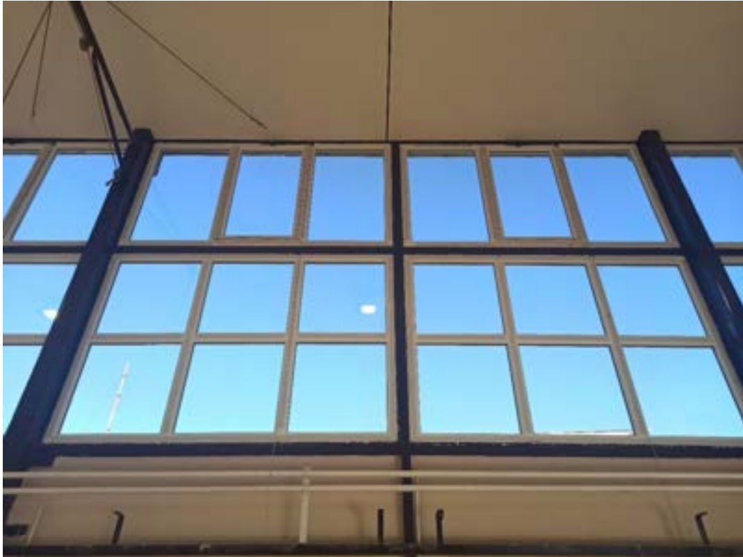
Уместо старе, постављена је ПВЦ столарија