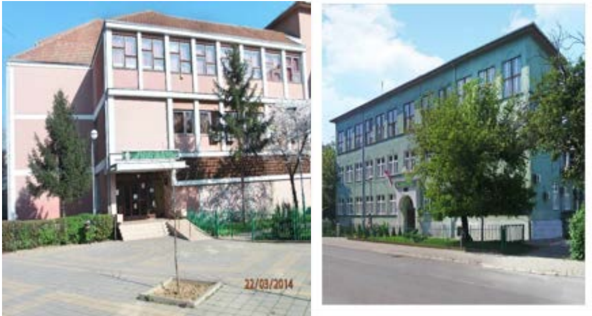
А овако су објекти Школе изгледали пре реновирања 2018. и 2019. године

Целокупан школски простор састоји се од школске зграде која заузима површину од око 5730 м 2 , спортских терена, површине око 1200м 2 и дворишта школе површине око 8867 м 2 .