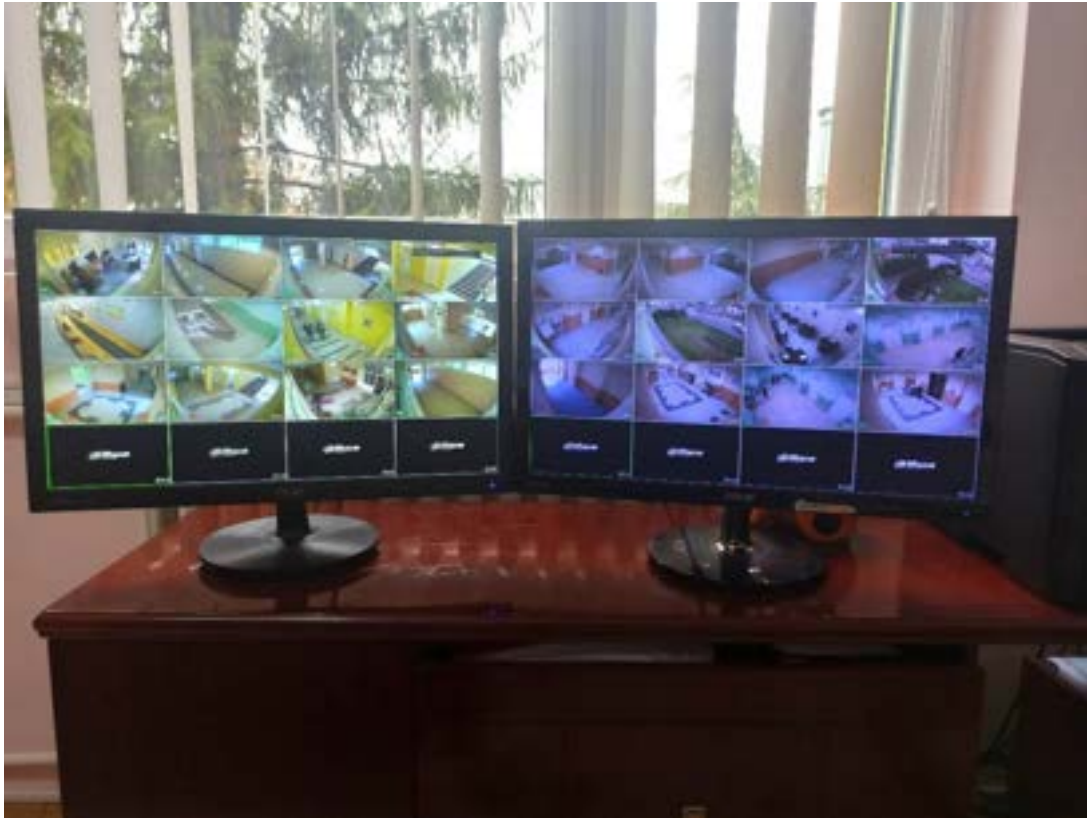
Школа поседује унутрашње и спољашње камере

Школа је приступила реконструкцији постојећег видео-надзора. Са овим подухватом повећан је број надзорних камера и уграђен је рек орман за пратећу ИТ опрему. Побољшањем система видео-надзора створени су услови за већу безбедност ученика и запослених, као и појачана могућност увида у дешавања у највећем делу школског објекта.