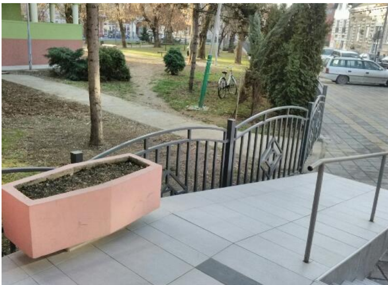
Приступна рампа за особе са инвалидитетом