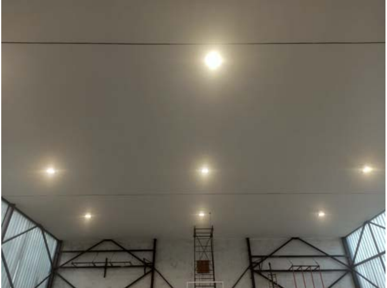
Урађена је енергетски ефикасна реконструкција плафона, са новим осветљењем

Са новом естетиком, али пре свега функционалнијим и безбеднијим основама за рад, настава физичког васпитања имаће нови квалитет.