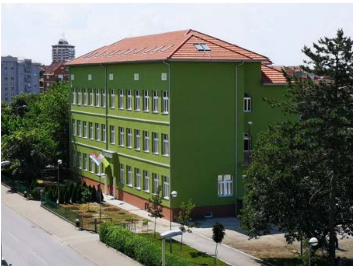
Стара, задужбинска школска зграда у потпуном новом сјају, по завршеној реконструкцији