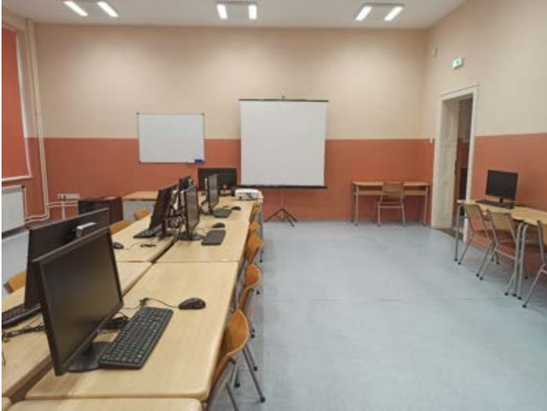
Кабинет са новом опремом

На пролеће 2021. године посредством Министарства просвете науке и технолошког развоја опремљен је нови информатички кабинет. Донирано је 15 монитора са адаптерима, преко којих је школа повезана на сервер Министарства. Овим је омогућено да две групе једног одељења истовремено прате наставу.