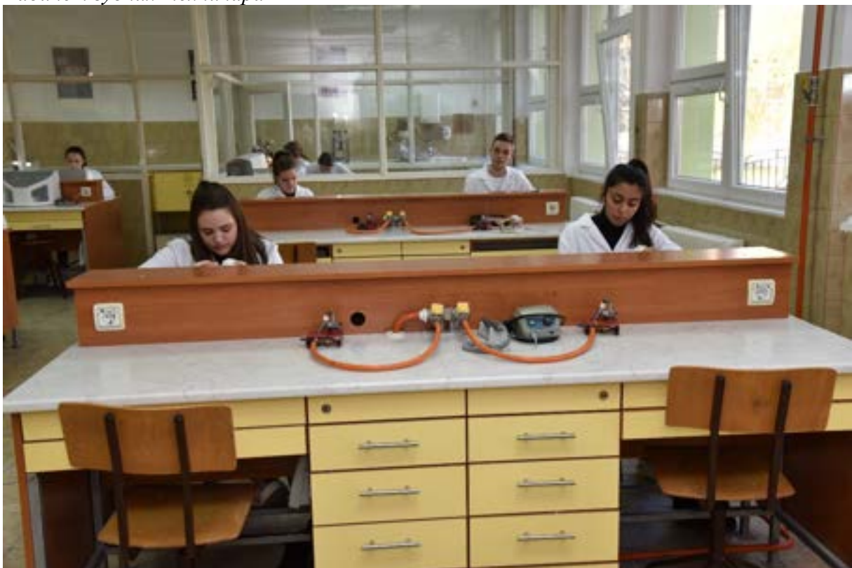
Кабинет зубних техничара