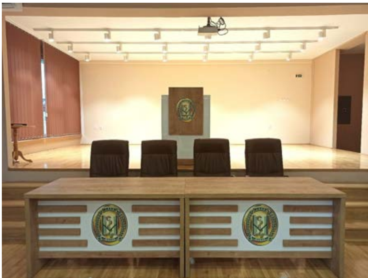
Нова говорница и сто за седнице