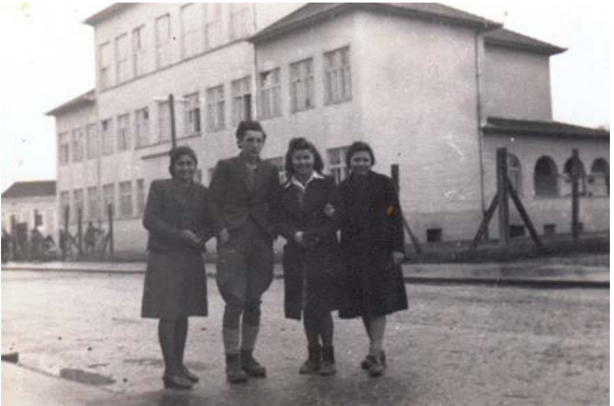
Зграда садашње школе ратне, 1943. год.