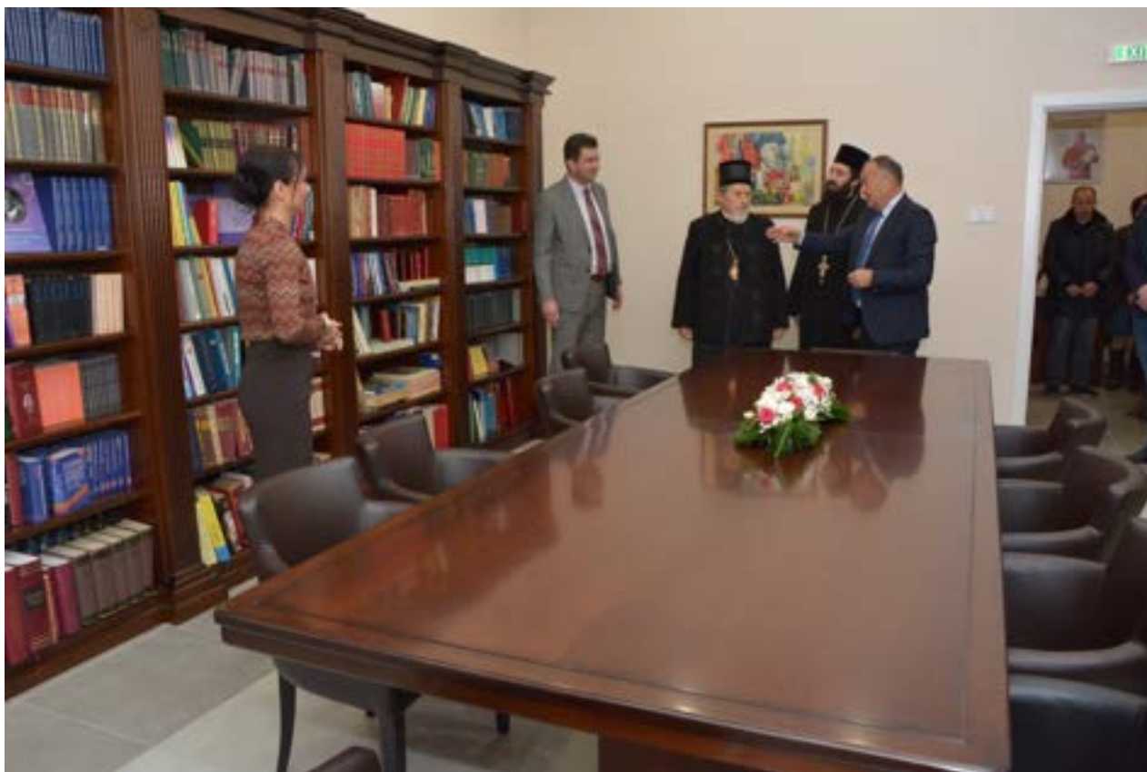
Нова школска читаоница