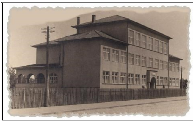
Задужбина др Андре Јовановића 1946. године