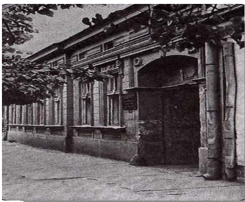
Школа 1946. године

Школа се у свом раду ослања на сарадњу са великим бројем социјалних партнера. Од самог почетка рада школе постоји велико интересовање ученика за упис у школу.