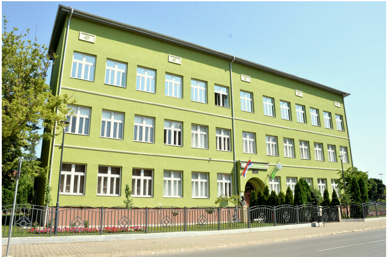
Стара, задужбинска школска зграда у потпуном новом сјају, по завршеној реконструкцији