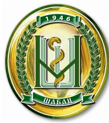
Садашњи знак Школе