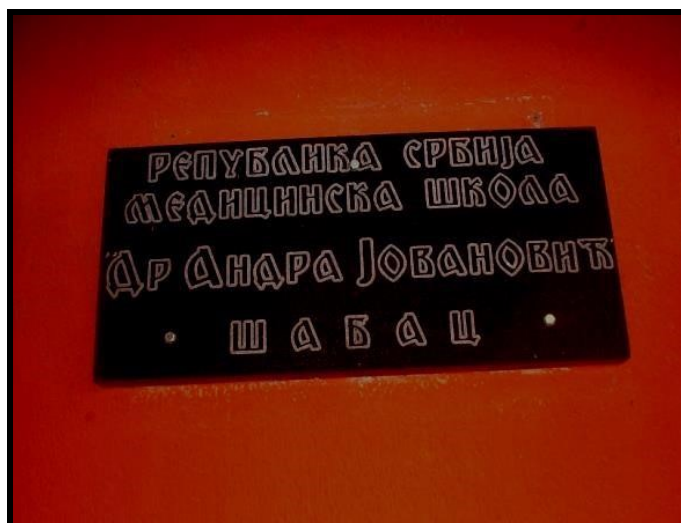
Табла са називом Школе