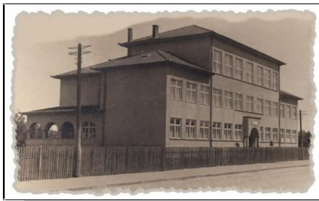
Задужбина др Андре Јовановића 1946. године