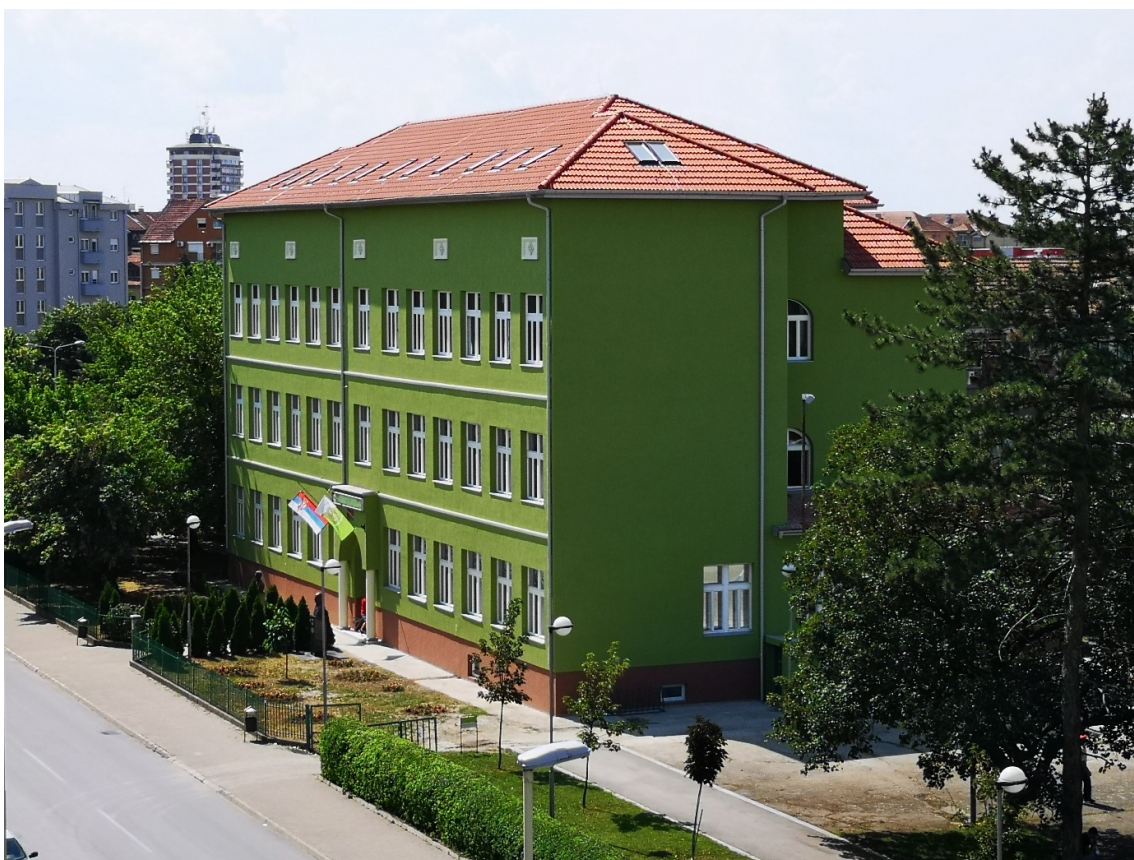
Школа данас - стара, задужбинска школска зграда у потпуном новом сјају, по завршеној реконструкцији

У току рада школе у њој су се образовали различити профили: медицинске сестре, лабораторијски и фармацеутски техничари од 1960. године, зубни техничари од 1966. године, санитарни техничари од 1978. године, радиолошки техничари од 1979. године, физиотерапеутски техничари од 1984. године, стоматолошке сестре техничари од 1991. године, фризерски од 1987. године, од 1999. године педијатријске сестре, од 1980. године и 2002. године гинеколошко-акушерске сестре, а од 2003. године и козметички техничари. 2015/16. школске године извршена је верификација смера медицинска сестра-васпитач, као и смера здравствени неговатељ, тако да је Школа сада верификована за све образовне профиле из области здравства и социјалне заштите.