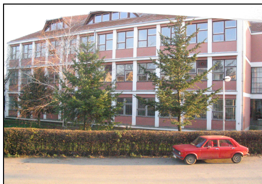
Друга, „нова“ зграда, из 1997.год