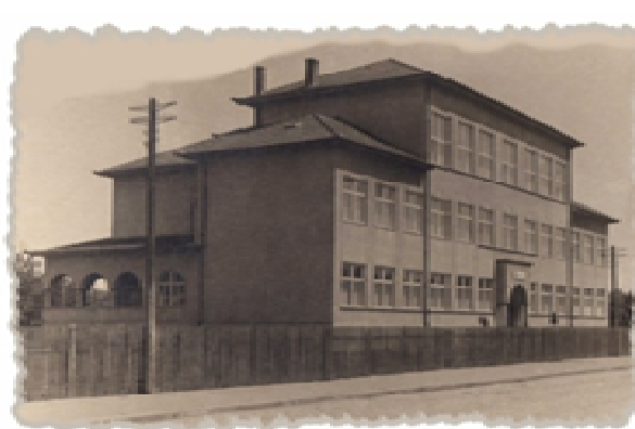
Задужбина др Андре Јовановића