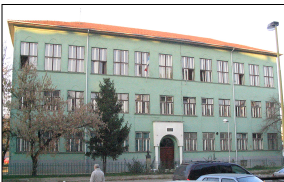
Стара, задужбинска зграда, пре надоградње