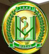
КАБИНЕТ ЗДРАВСТВЕНЕ НЕГЕ бр. 3