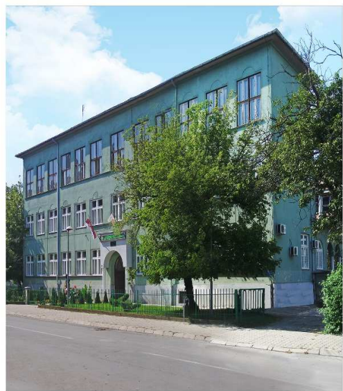
А овако су објекти Школе изгледали пре реновирања 2018. и 2019. године