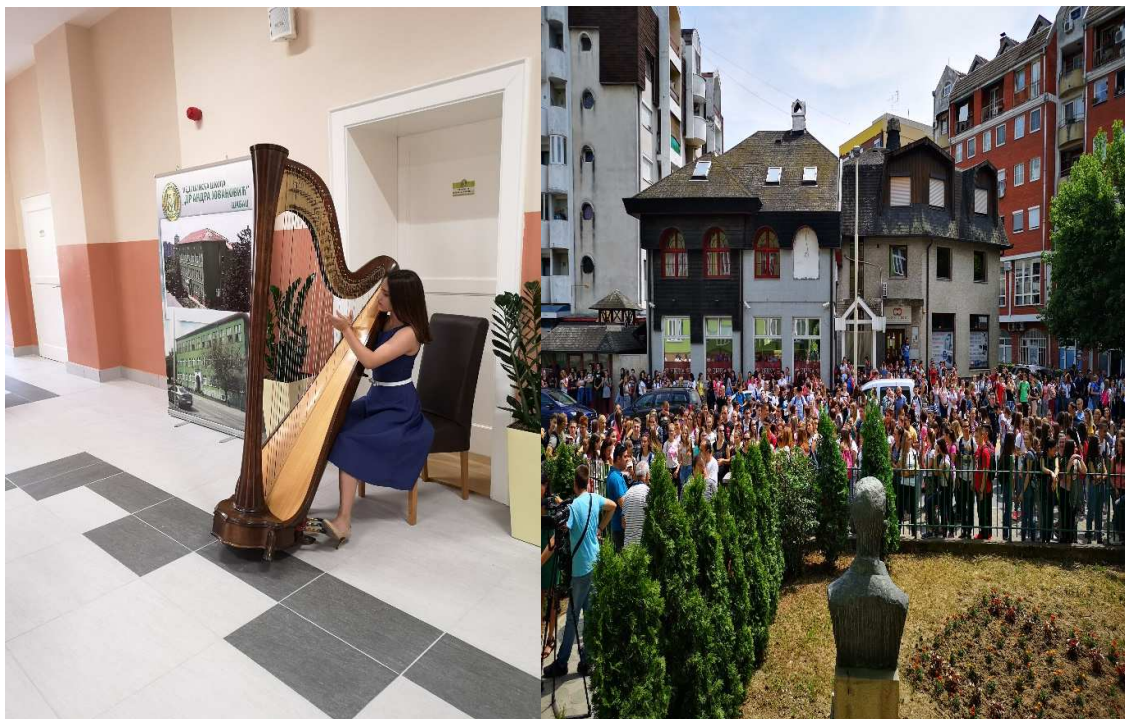
Свечано отврање реновинаране задужбинске школске зграде