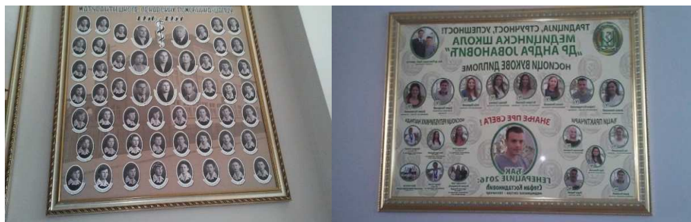
Матуранти наше Школе, некад и сад

Ходнике Медицинске школе "Др Андра Јовановић" оплемењују слике које величају праве вредности.