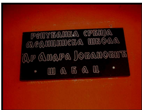
Табла са називом Школе, 2003.