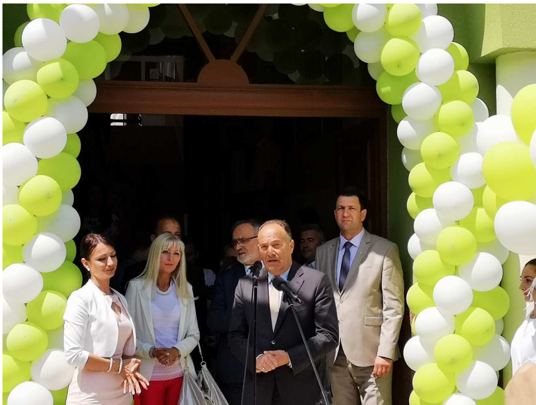
У присуству министра просвете господина Младена Шарчевића свечано отварање реновинаране задужбинске школске зграде