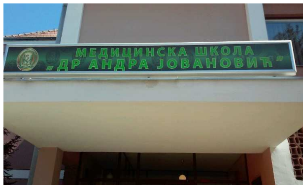
Табла са називом Школе, 2013.