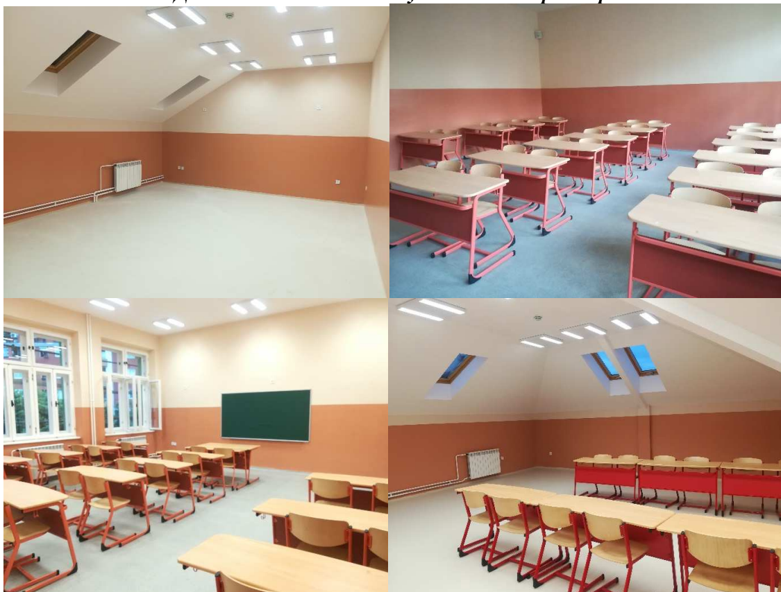
Део новог кабинетског и учиоичкиог простора који је у употреби почев од школске 2018/2019. год.