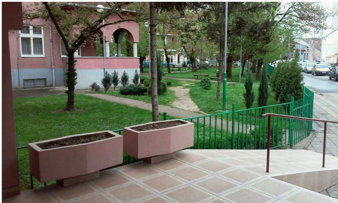
Објекти и двориште школе обезбеђени су унутрашњим и спољашњим видео-надзором

Наша Школа је савремена, одлично опремљена и безбедна образовно-васпитна установа која пружа изузетне могућности рада и учења у пријатном окружењу.