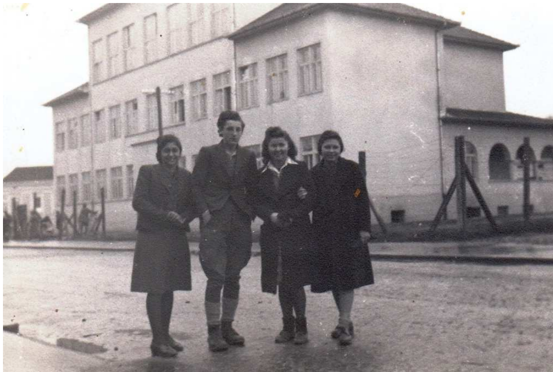
Зграда садашње школе ратне, 1943. год.

Школа је регистрована код Привредног суда у Ваљеву, бр. XI 179/89. год, а верификована од Министарства просвете Републике Србије, бр. 022-05-233/94-03, од 6. 04. 1994. год.