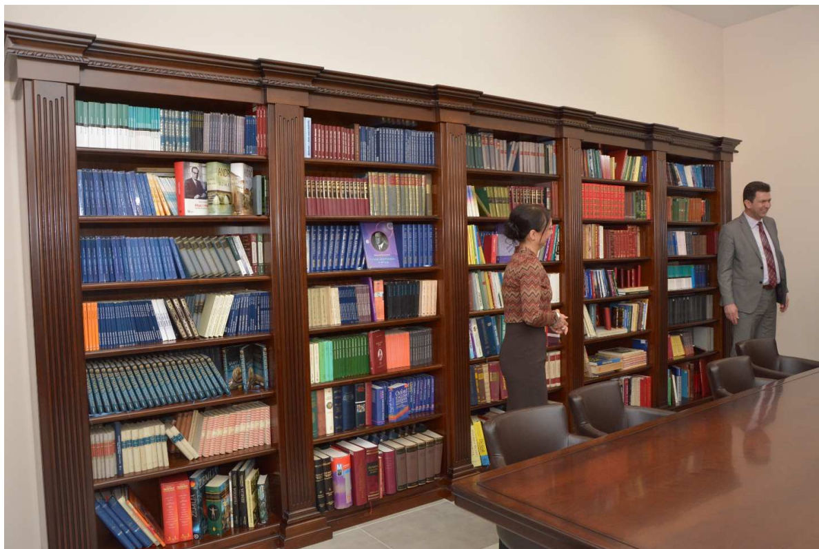
У присуству министра просвете господина Младена Шарчевића свечано отварање реновинаране школске библиотеке