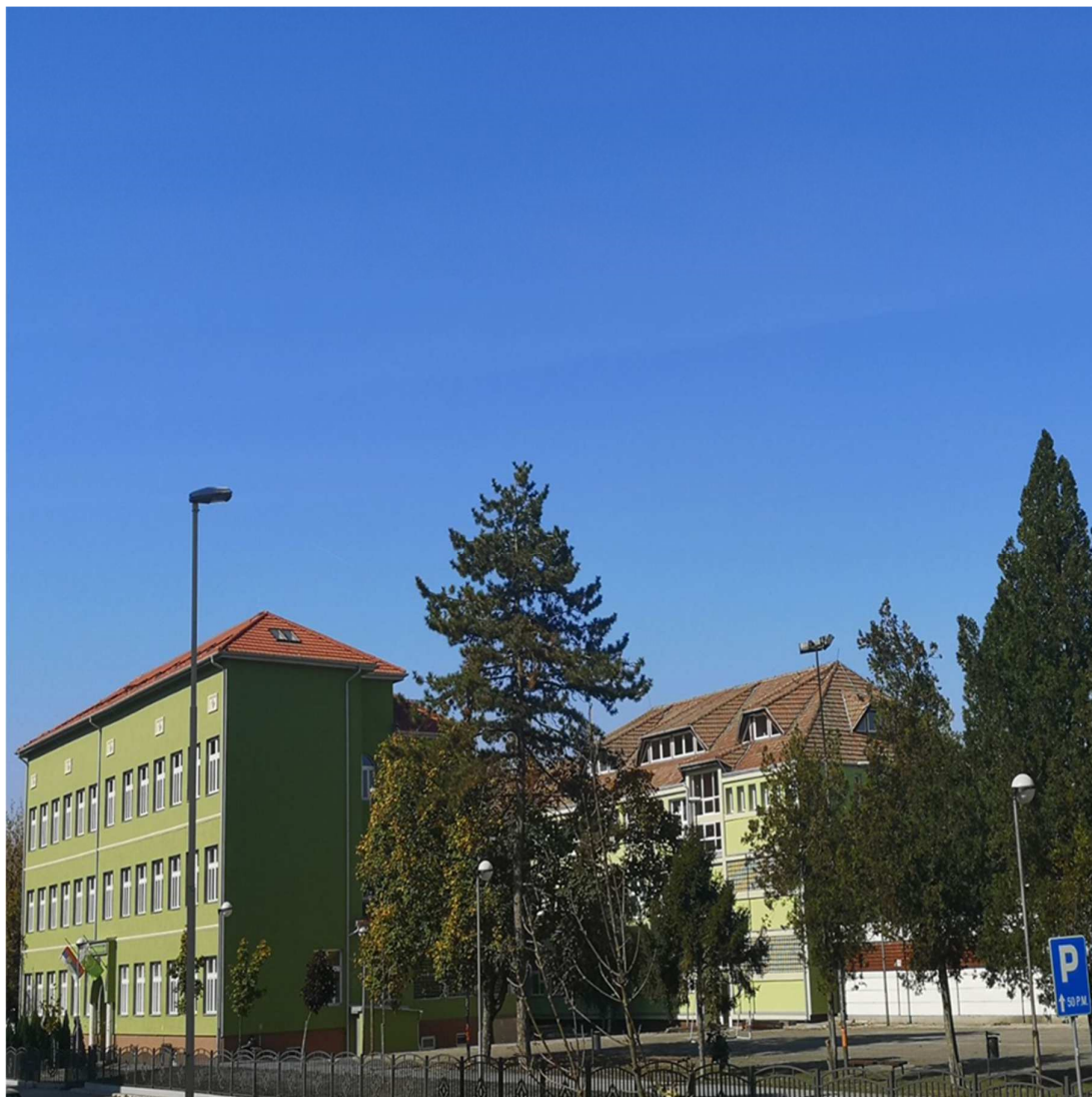
Реновирана и нова зграда школе