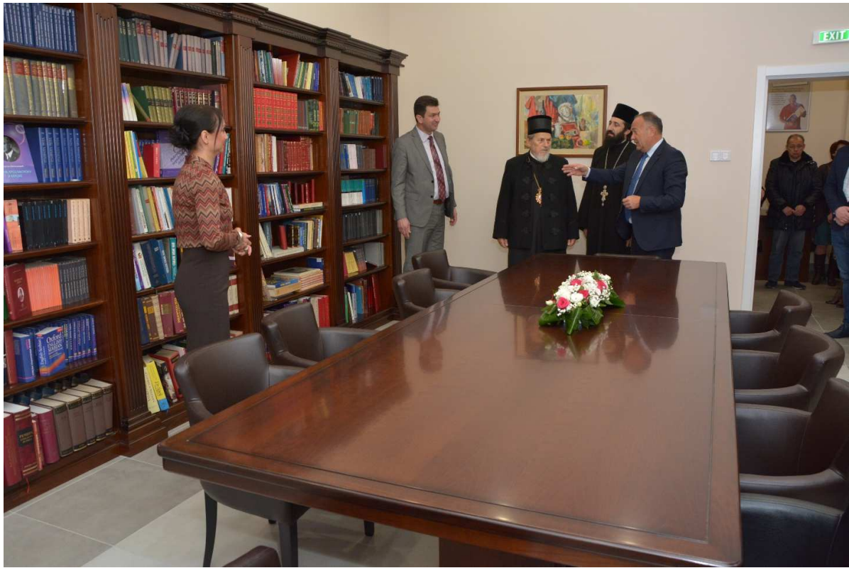
Нова школска читаоница