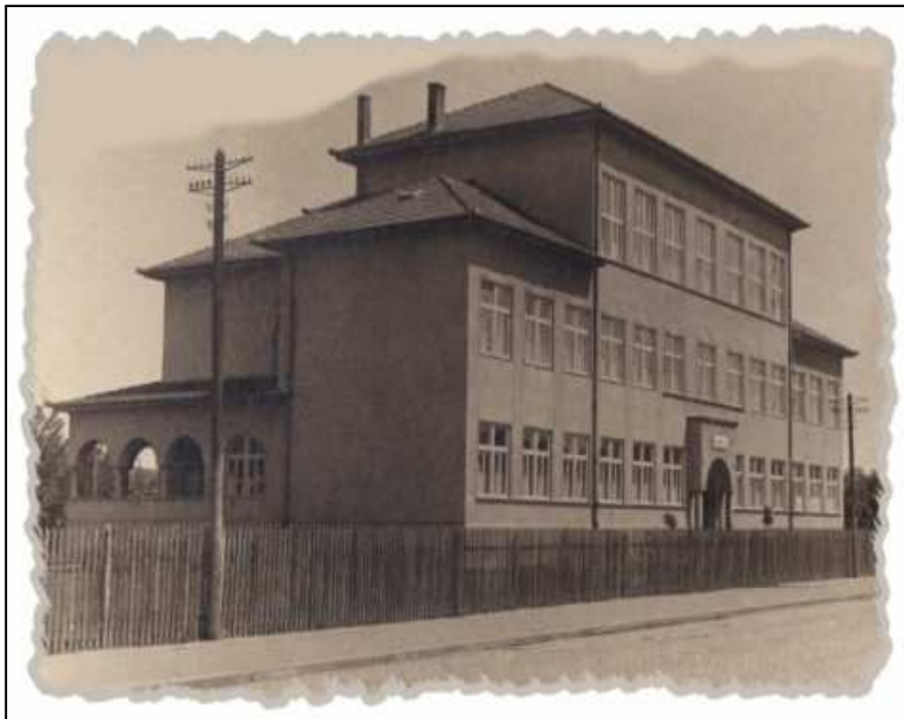
Задужбина др Андре Јовановића